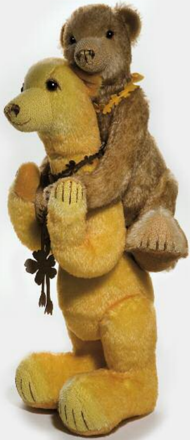
Cindy + Filipa Limited Edition 15 49 cm / 19,5" / 39 cm / 15,5"