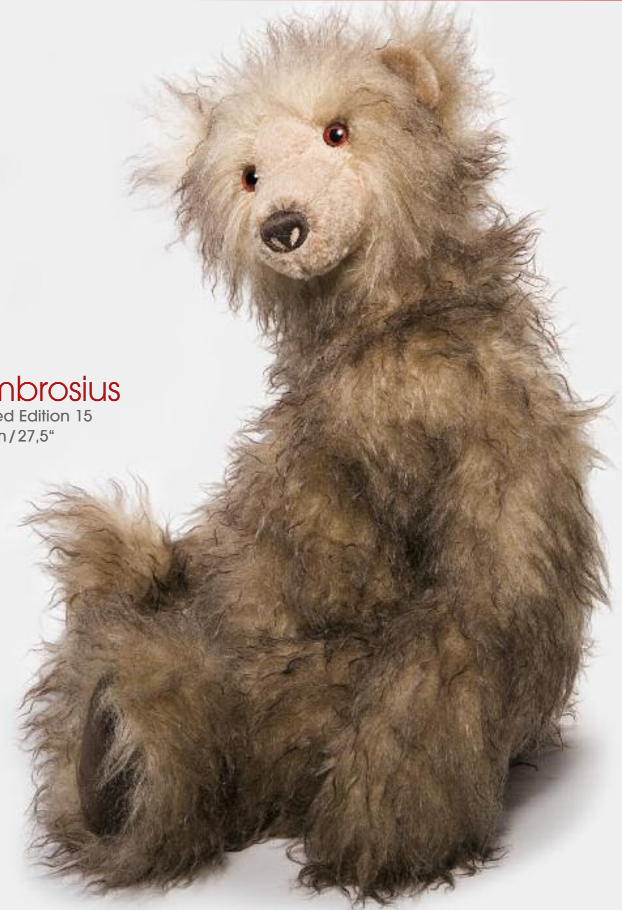
Ambrosius Limited Edition 15 70 cm / 27,5"