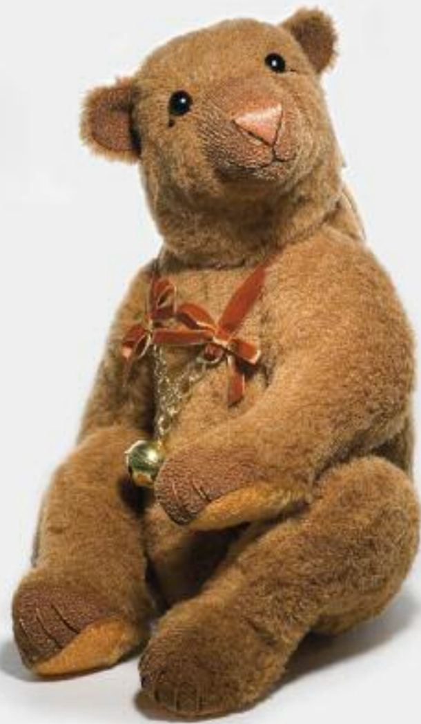
Paulinchen Limited Edition 15 36 cm / 14"