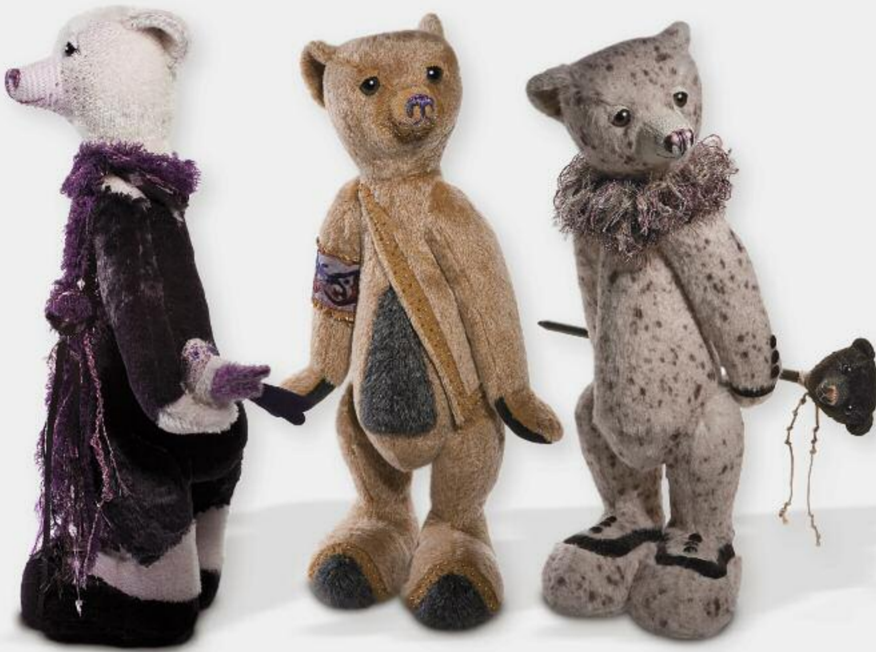
Vicco Limited Edition 15 57 cm / 22,5"