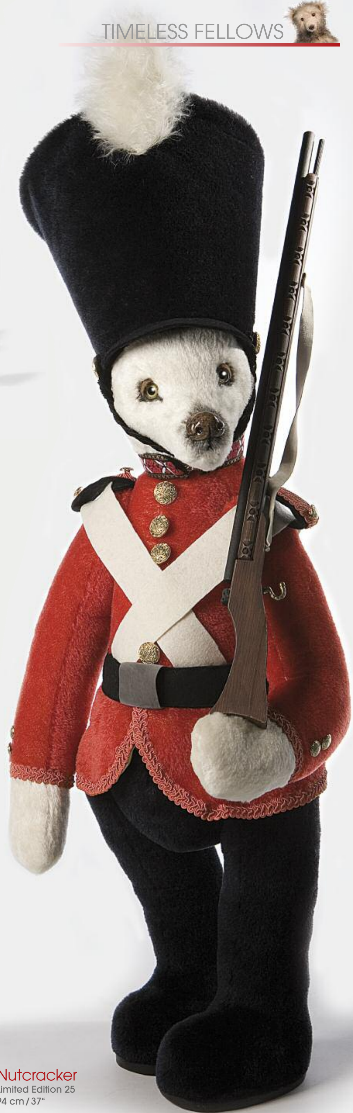
Nutcracker Limited Edition 25 94 cm / 37"