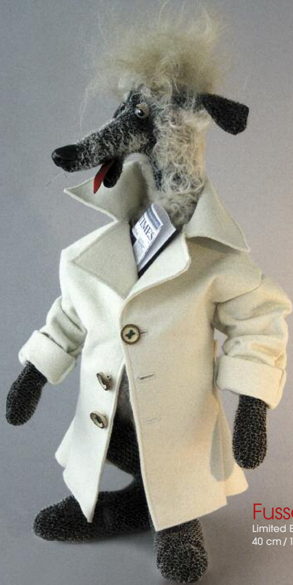
Fussel Limited Edition 15 40 cm / 16"